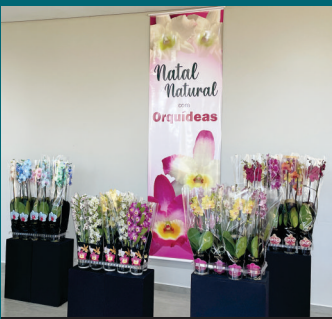
Espaço das Orquídeas