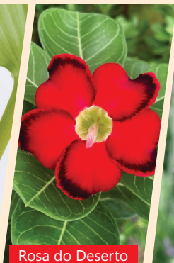
Rosa do Deserto