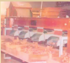
Barracão em funcionamento

Um grande acontecimento marca o dia 28 de Novembro de 1980: a inauguração do novo Barracão de Armazenamento e Beneficiamento de Bulbos, Bulbilhos e sementes de Gladiolos, para atender o mercado interno e também para exportação. Com 8.500m 2 tudo era grandioso, construção moderna, grandes vãos livres, cobertura de aço, máquinas importadas e etc.