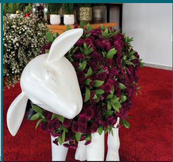
Ovelha de Crisântemo e Ruscus