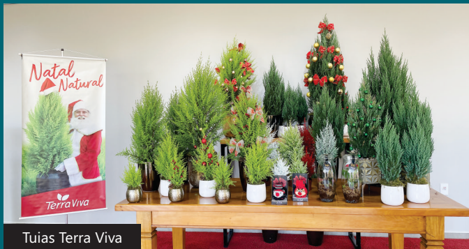
Tuias Terra Viva

Na última semana de Agosto, foi realizado um encontro com nossos clientes para fortalecer laços, expor o mix de produtos Terra Viva e trazer um pouquinho do clima natalino com nossas Tuias, além da presença especial das nossas ovelhinhas de flores.